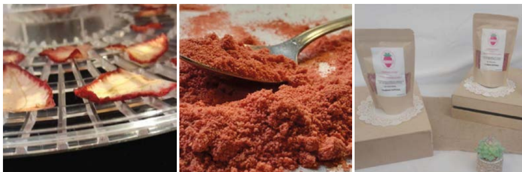
Figura 2. 1: Proceso de deshidratación de la fresa. 2: Fresa deshidratada recién triturada 3: Prototipo del producto 200 gr.