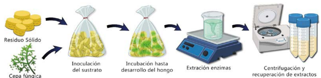
Figura 3. Esquema de la producción de enzimas en un sistema de fermentación en estado sólido

Estas enzimas poseen amplia variedad de aplicaciones prácticas, por ejemplo, en la industria alimentaria se utilizan para la clarificación de jugos, el ablandamiento de carnes, la producción de lácteos y para mejorar texturas y sabores. Además, encuentran aplicación en la industria textil para mejorar la suavidad de las telas, en la industria farmacéutica para la síntesis de precursores, en bioenergética para la producción de biocombustibles, en la producción de piensos para mejorar la nutrición de los alimentos, como aditivo en detergentes para facilitar la remoción de grasas y proteínas (Figura 4) entre otros.