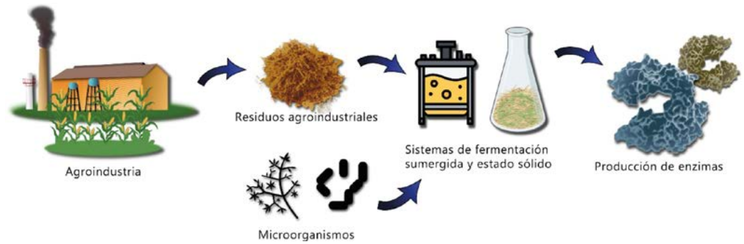
Figura 2. Esquema de producción de enzimas a partir de residuos agroindustriales en fermentación sumergida y estado sólido.

Los sistemas de FES son más adecuados para la valorización de residuos sólidos, como los bagazos y rastrojos; ya que se emplean matrices sólidas que permiten el desarrollo de microorganismos. Asimismo, posee diversas ventajas en comparación a la FS como son el uso reducido de agua, mayor disponibilidad de oxígeno, además de que en algunos casos, los sustratos pueden incorporarse al sistema sin un proceso de esterilización. En la actualidad, los sistemas de FS son los más empleados para la producción de enzimas y genera expectativa en la valorización de residuos sólidos, en particular para la producción de enzimas usando cepas fúngicas (Figura 3).