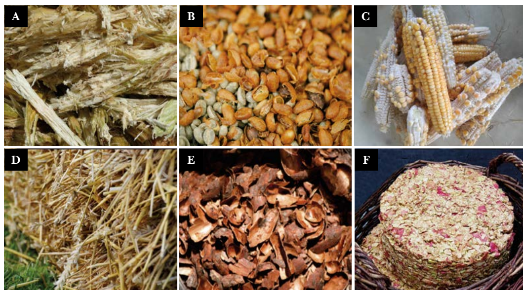
Figura 1. Residuos agroindustriales generados en México. A) Bagazo de caña de azúcar; B) Cáscara de café; C) Mazorcas de maíz; D) Paja de trigo; E) Cáscara de cacao y F) Orujo de manzana.

Las enzimas y preparaciones enzimáticas representaron para México, un valor comercial de USD $184.7 millones en 2017, aumentando hasta los USD$208.7 millones en el año 2022. El incremento en el uso de enzimas a nivel industrial puede deberse a las ventajas que presentan las reacciones de catálisis enzimática con respecto a su contraparte química, entre las que se pueden destacar: menor gasto energético, reducción de los efluentes contaminantes y debido a su especificidad, con la que se obtienen productos homogéneos. Se propone la valorización de residuos agroindustriales para la producción de enzimas de interés industrial, haciendo uso de sistemas de Fermentación Sumergida (FS) y Fermentación en Estado Sólido (FES) (Figura 2). La FS posee ventajas como permitir un fácil monitoreo de variables como la temperatura, el pH y la agitación, además, la FS es el sistema más empleado para la producción industrial de enzimas, aunque existen esfuerzos por incorporar residuos sólidos como fuente de carbono, se sigue optando por el uso de residuos solubles como melazas, suero de leche, licor negro de la industria papelera, como principales fuentes de carbono en estos sistemas.