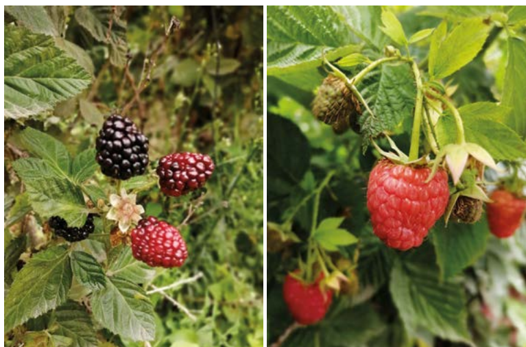
Figura 2. Cultivos de zarzamora y frambuesa en proceso de maduración.

El espacio que se destina a estos cultivos va desde 100 m 2 hasta 10,000 m 2 , obteniendo ventajas superiores a las siembras tradicionales, ya que se cosecha en el caso de berries es dos veces al año en periodos de tres meses seguidos. La primera cosecha se realiza en abril y la segunda en octubre y esto permite a los productores buscar un mercado entre cosecha y cosecha incrementando los ingresos económicos. La producción obtenida en 2023 fue de 2,800 cajas al año de zarzamora y frambuesa, cada caja cuenta con 12 empaques de