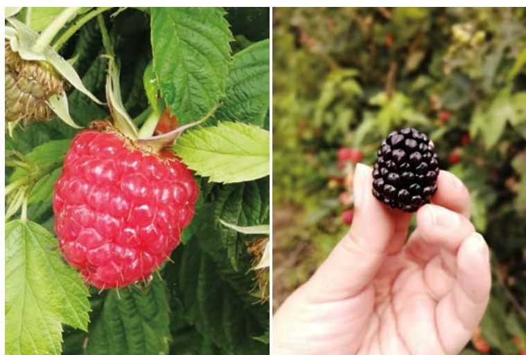
Figura 3. Cosecha de berries en el municipio de Calpan, Puebla, México.