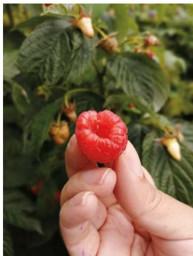
Figura 4. Frambuesa variedad marbella.