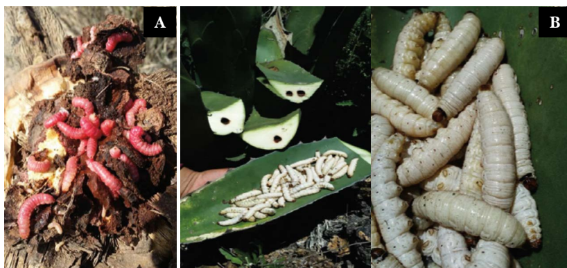
Figura 4. A: gusano rojo y B: gusano blanco del Agave.