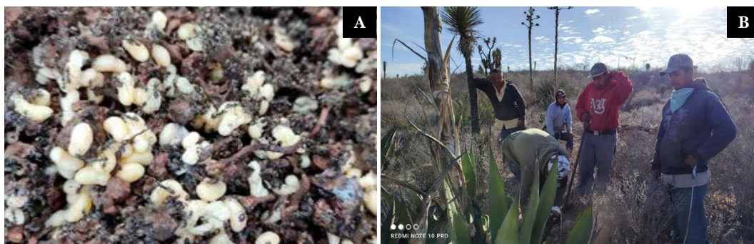
Figura 3. A: Larvas de hormiga escamolera. B: Familia recolectorora de escamoles.